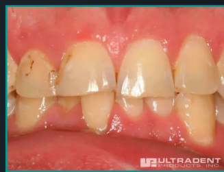
Upper Arch Restoration for Eight Teeth