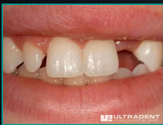
Missing Lateral Incisor and Peg Lateral