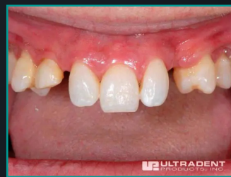
Esthetic Alternative to Partial Dentures