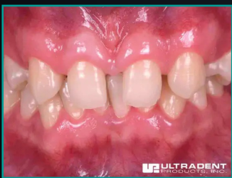
Upper Arch Restoration