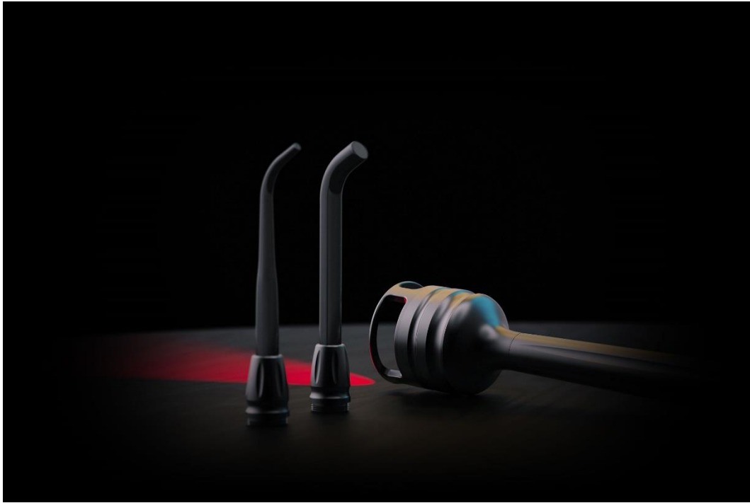
سری های فتوبیوماژولاسیون همراه با لیزر Gemini EVO

افزایش قدرت لیزر Gemini EVO نسبت به نسل قبلی خود به برش سریع‌تر برای پزشک منجر می‌شود. با لیزر اصلی جمینی، مشکلی با سرعت برش وجود نداشت اما نسل جدید حتی بهتر از قبلی برش می‌دهد.