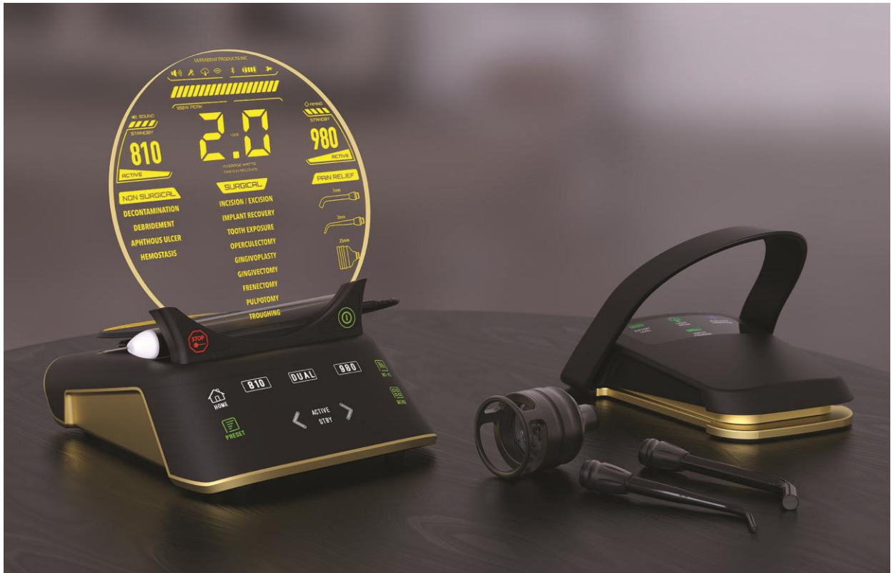
لیزر Gemini EVO شامل یک پدال پا و سه سری PBM می باشد.

لیزر Gemini EVO که بر اساس لیزر اصلی Gemini™ ساخته شده است، صفحه کاربری پیشرفته تری را با ده‌ها پیش‌تنظیم، قدرت اضافی، و اولین قسمت تجزیه و تحلیل در نوع خود ارائه می‌کند تا تجربه شما را در حین ردیابی عملکرد و بازده ارتقاء بخشد.